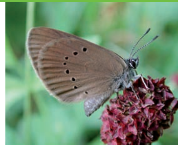
„Abenteuer Faltertage“ – eine Aktion des BUND