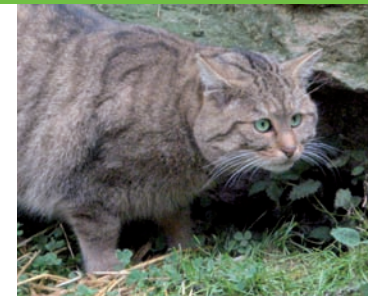
BUND-Wildkatzenprojekt: „Rückkehr auf leisen Sohlen - Ein Rettungsnetz für die Wildkatze“