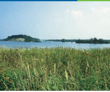
BUND-Naturschutzprojekt „Goitzsche“ bei Bitterfeld